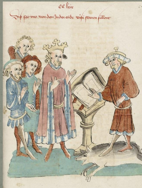
Karl der Große als Gesetzgeber des Schwabenspiegels