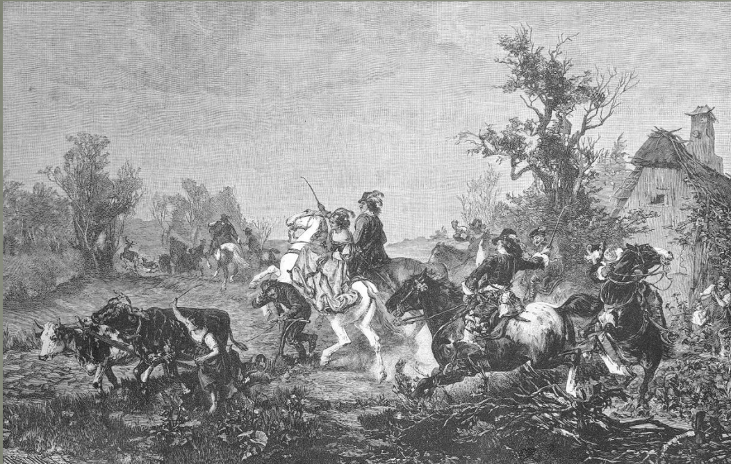
Eine Herrenjagd im siebenzehnten Jahrhundert. Nach dem Oelgemälde von W. Räuber.