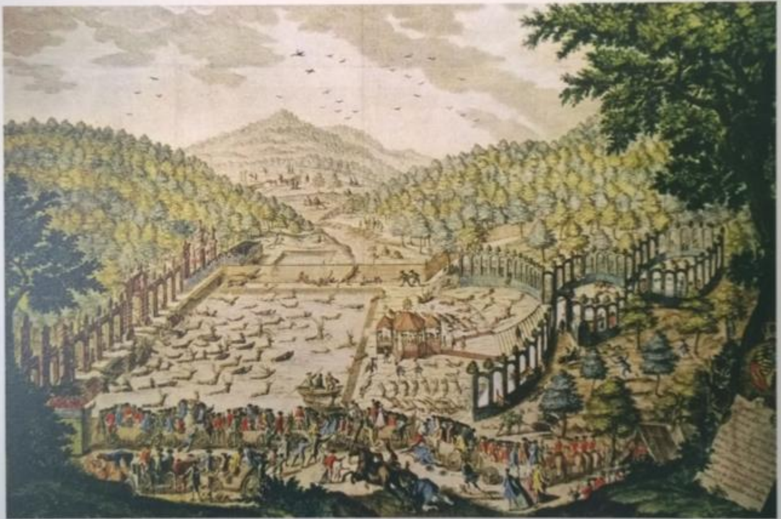
Hofjagd am 8.10.1748 in Leonberg (Württemberg). Kolorierter Kupferstich. Jagd- und Fischereimuseum München.