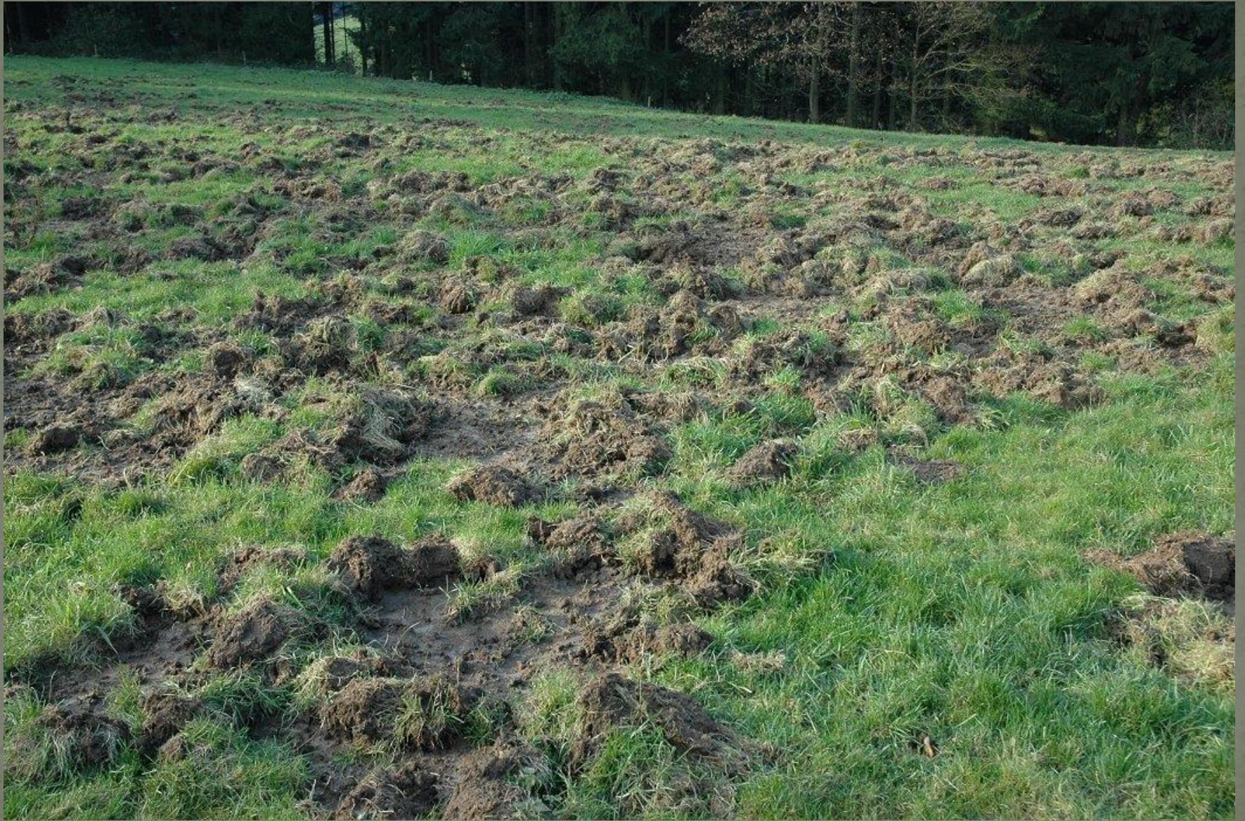
November 2007