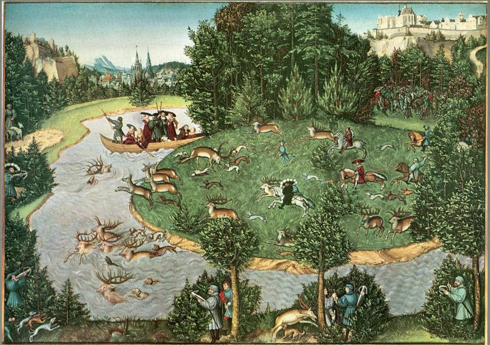
Lucas Cranach der Ältere, Hirschjagd des Kurfürsten Friedrich des Weisen (1529)