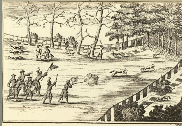
Lappenjagd auf Füchse, Flemming, 1724

In der Folge kam es zu den Bauernkriegen!