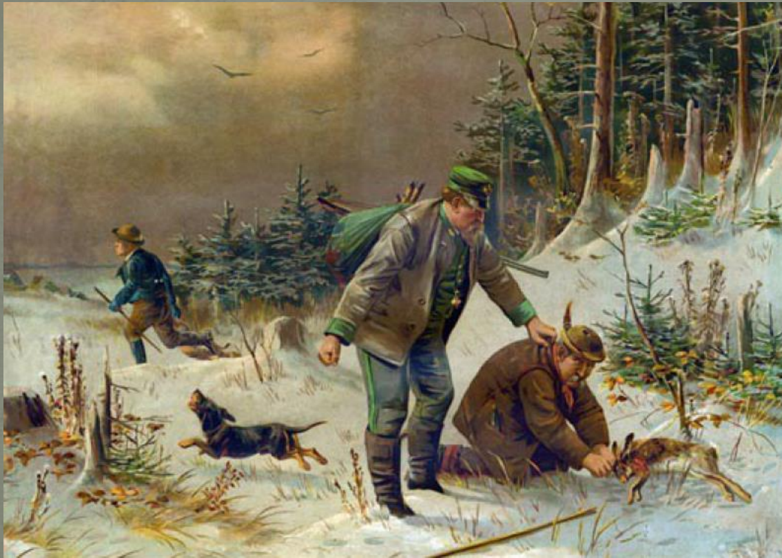
Schlingensteller, unbekannter Künstler