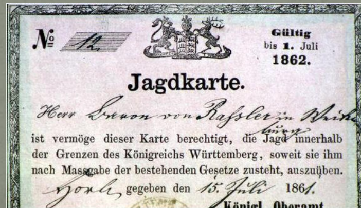
Jagdkarte des damaligen Königreich Württemberg

In vielen Orten gründeten sich rechtsfähige Jagdvereine, in denen sich die örtlichen Landwirte zu sogenannten „Bauernjagden“ zusammenschlossen um gemeinsam einen Jagdbezirk zu pachten und die Jagd auszuüben.